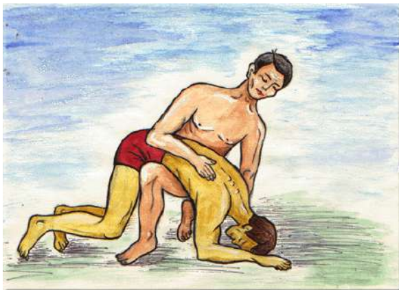
Удаление воды из дыхательных путей утопавшего.